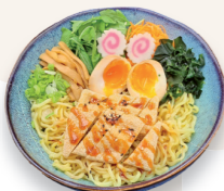
Au tofu 13.70€