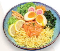
Au saumon 16.50€