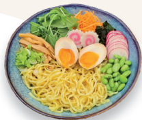
Aux légumes 13.10€

Nouilles japonaises temomi, pousse de bambou, carotte, salade roquette, cébette, œuf mariné au soja, naruto maki, algue wakamé. Le bouillon à base de miso, préparé avec soin, vous sera servi à part. Ces ingrédients délicats, riches en saveurs, méritent une attention particulière. Afin de préserver le plaisir de dégustation, nous vous invitons à les réchauffer vous-même pendant 2min30 à 900 watts. Assurez-vous de bien mélanger les ramen pour une dégustation optimale, révélant toutes les nuances de ce plat exquis. Bon appétit !