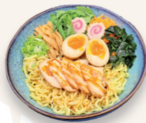
Au poulet 14.30€