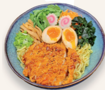
Au poulet pané 15.60€