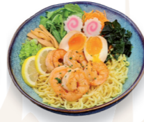
A la crevette grillée 16.10€